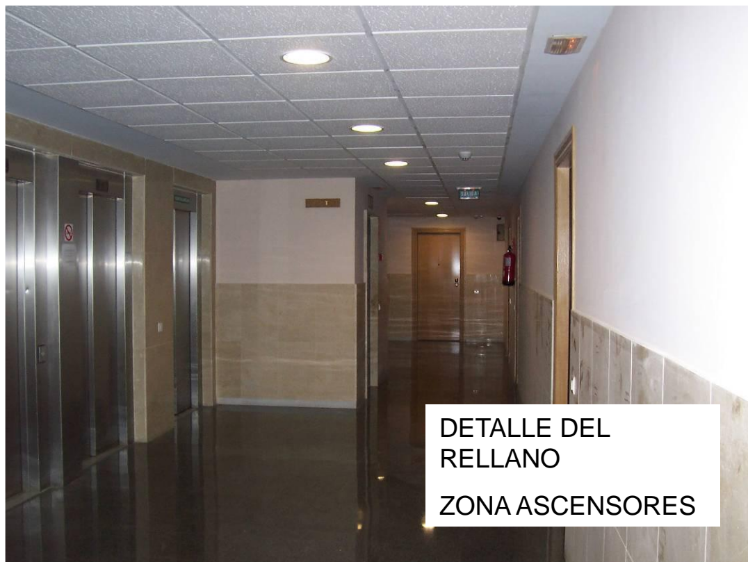
DETALLE DEL RELLANO ZONA ASCENSORES