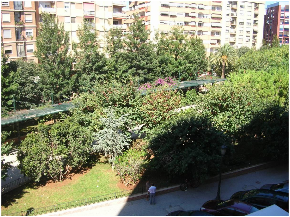
Frente a los Jardines de la calle Uruguay