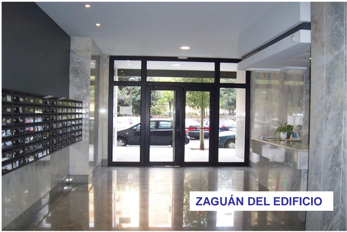
ZAGUÁN DEL EDIFICIO